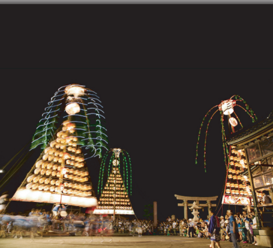
たてもん祭り(魚津市)