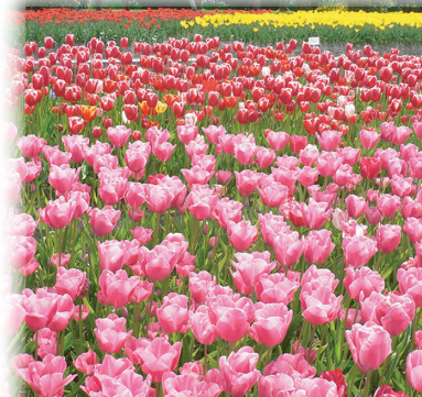
チューリップ(砺波市)