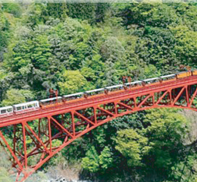
黒部峡谷トロッコ電車(黒部市)